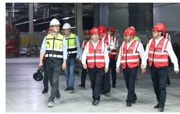
中建集团主题教育第二巡回指导组赴中建安装在盐重点项目开展基层调研座谈。

标，高位推动抓好组织实施，在理论学习、调查研究、推动发展、检视整改、宣传报道等方面全面发力；紧抓少数，以上率下推动走深走实，举办中建安装主题教育领导干部党性锤炼研修班，加强主题培训、开展实地研学，筑牢“根”“魂”优势；把握关键，一体贯通落实重点措施，深入查找分析在贯彻新发展理念、构建新发展格局、推动企业高质量发展中的问题短板及其根源，确保主题教育取得实效。期间还召开了调研座谈会，5名项目一线职工代表结合自身岗位实际和成长经历分别作了交流发言。集团党组主题教育第二巡回指导组成员，公司项目管理部、安全生产监督管理部、党建工作部、办公室相关负责人，苏杭公司相关负责人，部门、三级单位及项目相关负责人参加调研。