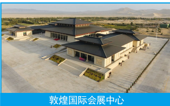
敦煌国际会展中心

守护历史记忆，建证文化足音。中国第二历史档案馆是集中保管中华民国时期（1912—1949）历届中央政权及其直属机构档案的中央级国家档案馆，是国家历史文献保护的重要场所。新馆投用后，将作为中央直属的国家级档案馆使用，成为南京市地标性“城市客厅”，更好地为党和国家中心工作服务，为人民群众服务。