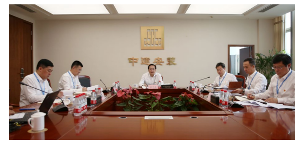
中建安装党委召开主题教育领导小组工作会议。

设。要以“合规管理深化年”等行动为契机，坚持底线思维，加强内控管理，深化法治央企建设，推动建设“互融、规范、高效、务实”的合规管理体系，持续抓好“稳增长、谋创新、促治理、防风险、强党建”五大任务，为公司高质量发展提供坚强保障。公司党委办公室、党建工作部、巡察办、合约法务部等部门主要负责人列席会议。