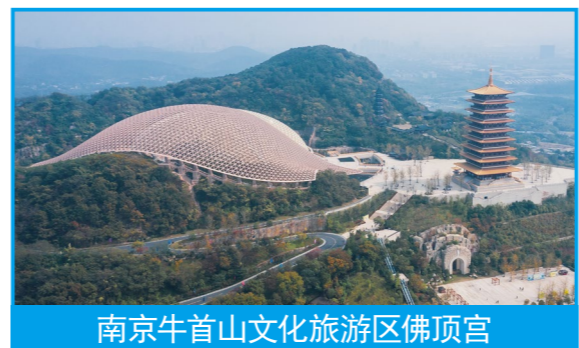
南京牛首山文化旅游区佛顶宫

文化的孕育和传承穿越千年，文明的融汇和互鉴历久弥新。敦煌国际会展中心是丝绸之路（敦煌）国际文化博览会的举办地，是甘肃乃至西北地区承载人数最多、规模最大、功能最全、智能化水平最高的会展中心之一，也是敦煌市标志性建筑之一，是敦煌市推动文化与旅游深度融合发展的代表项目。