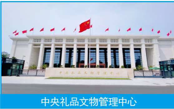
中央礼品文物管理中心

欲流之远者，必浚其泉源。作为新时代以来，在习近平总书记亲切关怀、高度重视下建成的国家级文化地标，中国历史研究院以中国社会科学院历史学部相关研究所为基础组建，是新中国成立以来组建的第一个国家级历史学综合研究机构，主要职责是统筹指导全国历史研究工作，整合资源和力量制定新时代中国历史研究规划，组织实施国家史学重大学术项目，植根于中华文化的深厚底蕴，担负着赓续文脉、发展文化的神圣使命。