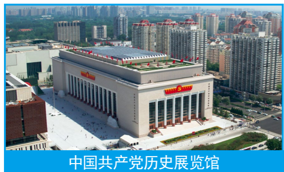
中国共产党历史展览馆

中华文脉绵延繁盛，中华文明历久弥新。似鼎如尊的中国历史研究院，壮观雄伟的中国国家博物馆，雍容大度的中国共产党历史展览馆，厚实庄严的北京大学红楼，气势恢宏的中国第二历史档案馆……站在新的历史起点，中建安装以责任担当和品质匠心“筑”力一座座文化殿堂相继落成，推动文化繁荣、建设文化强国，让璀璨而久远的中华文明焕发时代光彩。