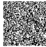
扫描下方二维码查看更多

数字引领未来，创新驱动发展。中建安装将持续贯彻数智建造、绿色建造新发展理念，助推传统建筑业转型升级，为推动粤港澳大湾区新金融中心建设贡献中建安装专业力量。