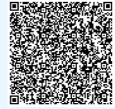
扫描下方二维码查看更多

本报讯（通讯员谭健）近日，华北公司承建的中储粮秦皇岛直属库海港粮储基地（一期）MEC项目正式投用。作为秦皇岛市重点民生项目，打造千亿级粮油食品加工产业园区的重点工程，项目一期建设大直径筒仓20座，仓容量25万吨，是国内在建最大直径粮仓；二期建设10栋浅圆仓，仓容量8万吨。建成后，在服务国家粮食宏观调控、保障京津冀粮食供应、维护国家粮食安全、保障民生、服务地方经济、推动高质量发展等领域具有深远意义。