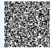
扫描下方二维码查看更多

本报讯（通讯员杨宇涵）近日，南京公司承建的经天路南延（东流路）一标段EPC项目正式竣工。作为中建安装首个市政EPC工程，项目北起经天路，南至捷运大道，位于宁镇扬同城化发展的核心位置及南京都市圈区域协同发展的重要轴线上。通车后，将与经天路、捷运大道、龙王山大道、麒麟岗大道等主干道无缝连接、串线成网，极大完善市域路网结构，构建内畅外联的道路体系，为周边居民提供便捷、舒适的交通出行环境，策应“宁镇扬”同城化发展再次加速。