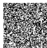
扫描下方二维码查看更多

共襄盛举，携手共赢。中建安装匠心打造、智慧赋能，助力建设京津冀对外开放的新高地、协同发展的先行区，擦亮廊坊展示对外开放形象的重要窗口。