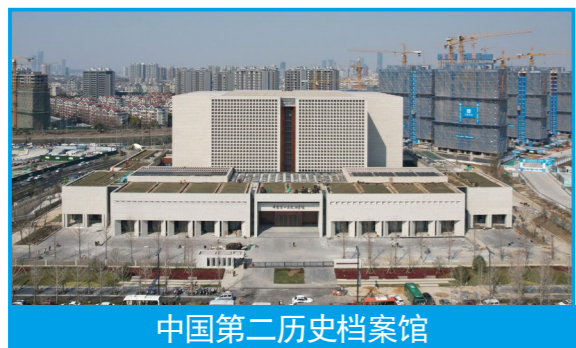
中国第二历史档案馆

传承优秀文化，涵养家国情怀。作为国家一级博物馆，桂林博物馆是展示桂林历史文化的综合性博物馆，是目前广西规模最大、功能最全的博物馆，现有馆藏文物3万余件，以桂林明代出土梅瓶、外宾礼品、明清书画珍品、桂林历史文物、广西少数民族文物等为馆藏特色，是展示桂林对外文化交流的重要窗口，已成为桂林人民的精神家园。