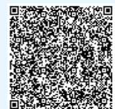
扫描下方二维码查看更多

本报讯（通讯员沈茹莹、郭海红）如今，在全世界第二大流动沙漠——塔克拉玛干沙漠腹地，有着“深地一号”“地下珠峰”之称的顺北油气田，一条条纵横的输油管线交错延伸，一座座高耸的原油储罐拔地而起。一支来自新疆安装的沙漠“钢铁医生”不断向大漠进军、向深地进军，陆续承建了顺北油气田地面工程29个无损检测项目，完成2座大型联合站、9台球罐及300公里管道无损检测任务，以精益求精的专业实力，全面保障油气安全运输存储，为我国探索深地、保障国家能源安全贡献中建力量。